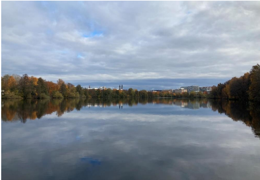
Figur 3. Sjön Trekanten omges av en trädridå som ger fladdermöss både skydd från rovfåglar samt vindstilla födosöksplatser där det samlas mycket insekter.